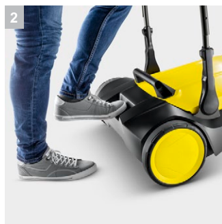
2 Удобная подножка