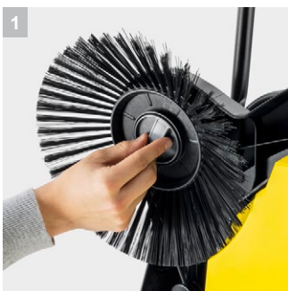
1 Практичный колпачок для боковой щетки.

Идеально подходит для круглогодичного применения на больших и широких площадях и тщательной очистки по краям: подметальная машина S 6 Twin с двумя боковыми щетками, 38-литровым контейнером для мусора и шириной подметания 860 мм.