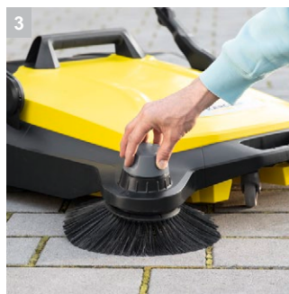
3 Гибкая регулировка высоты боковых щеток