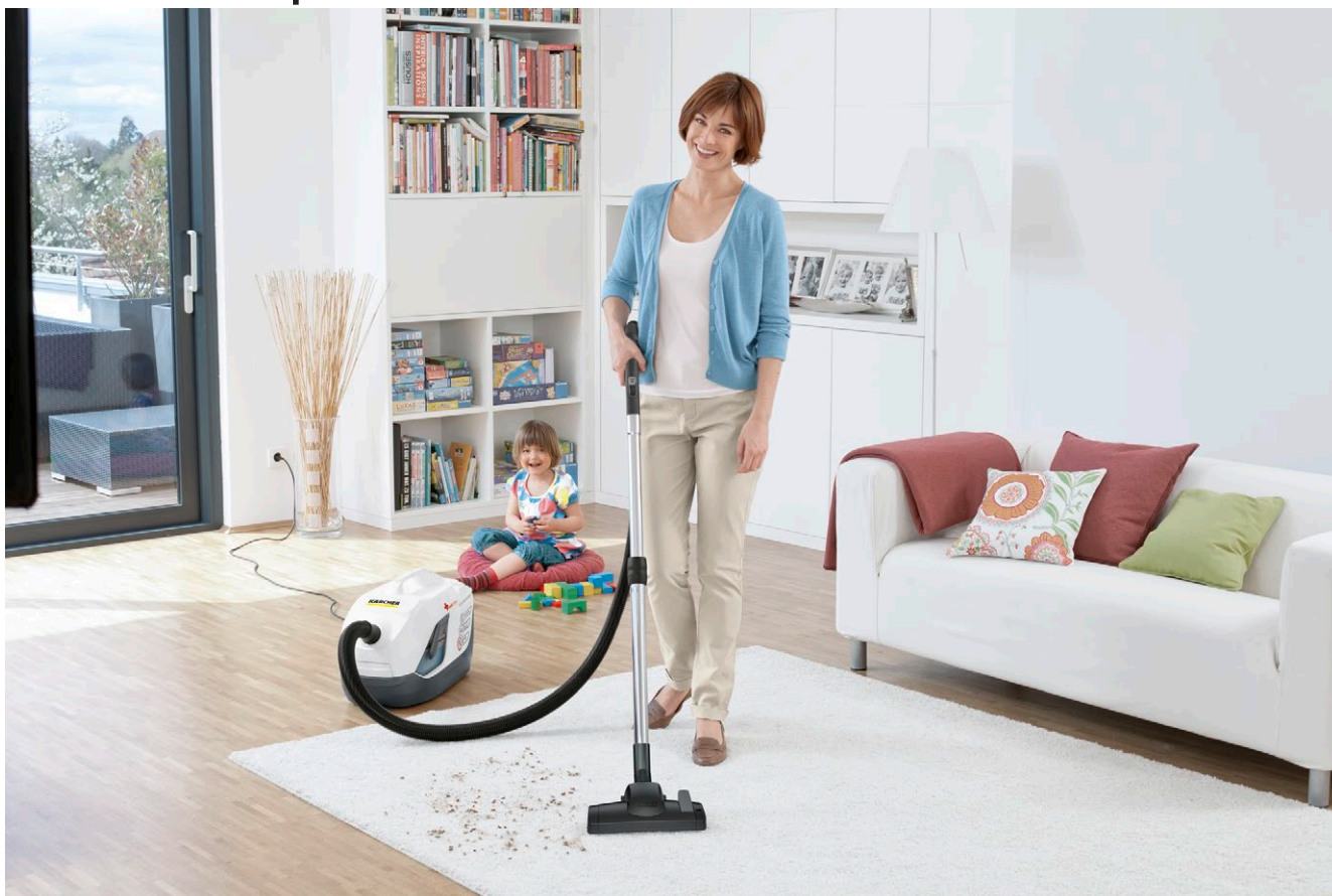
DS 6 Premium