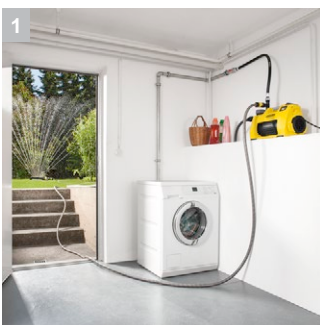
1 Легок в использовании в доме и в саду