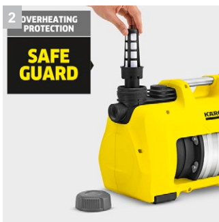
2 Безопасный и долговечный