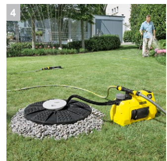
4 Оптимальное всасывание